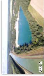
Abb. 2 Elbe-Seitenkanal und Bernsteinsee