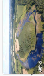
Abb. 4 Aller-Schleife südlich Dannenbüttel

weitere Details, Verbindungsstrecken und das Knotenpunktnetz auf https://fahrad-sassenburg.jimdofree.com