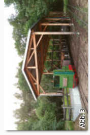
Abb. 3 Moorhof der Moorbahn in Westerbeck